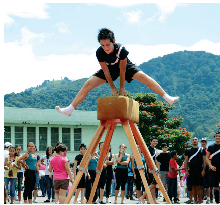
Desde el 2009, la Escuela de Nutrición de la UCR desarrolla el Modelo de Prevención de la Obesidad infantil Póngale vida en zonas rurales y urbanas del país (fotos archivo ODI).