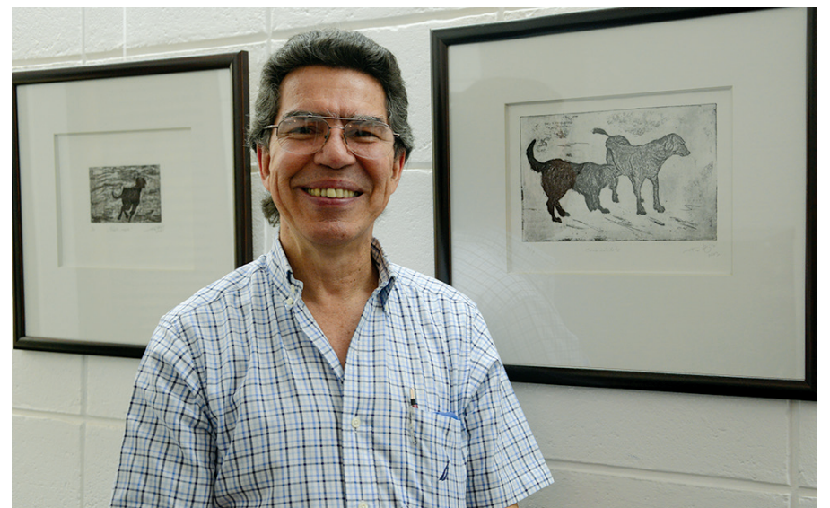
El artista junto a dos de las obras expuestas en el Decanato de la Facultad de Bellas Artes de la UCR.

Hernández enfatizó en que, según mediciones hechas, el grabado es más seguro de lo que se pensaba. Basta con una ventana abierta en el sitio donde se trabaja para que el aire circule. ■