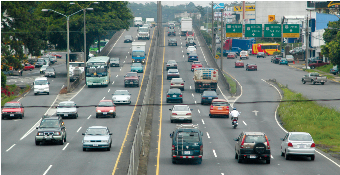
San José, Desamparados, Alajuela y Limón son los primeros cuatro cantones en donde ocurren más accidentes, según un estudio del Programa de Investigación en Desarrollo Urbano Sostenible (ProDus), de la UCR.