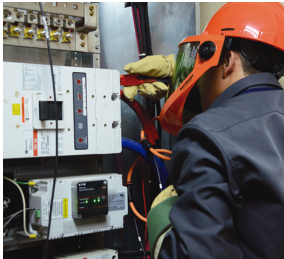
En el sector industrial el primer punto de medición es el transformador secundario o el tablero eléctrico principal; en el sector residencial se buscan los medidores.

Las empresas que regula Aresep son: Cooperativa de Electrificación Rural de Alfaro Ruiz R.L. (CoopeAlfaro Ruiz); Cooperativa de Electrificación Rural de Guanacaste (CoopeGuanacaste); Cooperativa de Electrificación Rural Los Santos (Coopesantos); Cooperativa de Electrificación Rural San Carlos (Coopesca); Empresa de Servicios Públicos de Heredia (ESPH); Junta de Administración de Servicios Eléctricos de Cartago (Jasec); Compañía Nacional de Fuerza y Luz (CNFL) e Instituto Costarricense de Electricidad (ICE).