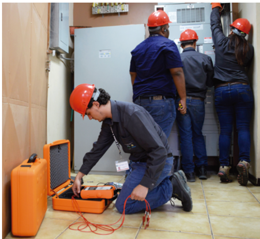
Durante la visita de la Unidad verificadora de la calidad del suministro eléctrico de la UCR a la Municipalidad de Heredia el 24 de agosto, se instaló el equipo en el tablero eléctrico principal.