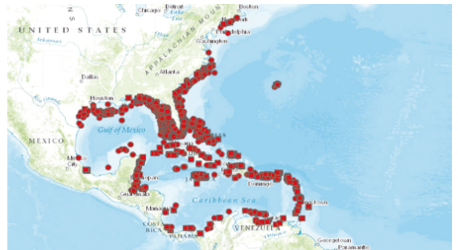
Mapa de la dispersión invasiva del pez león en el océano Atlántico occidental al 2015 (fuente: Servicio Geológico de Estados Unidos).