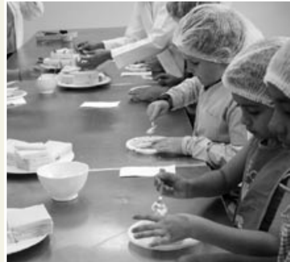
Las niñas y los niños aprendieron a realizar el montaje de sus meriendas..

* Nutricionistas y profesoras de la Escuela de Nutrición