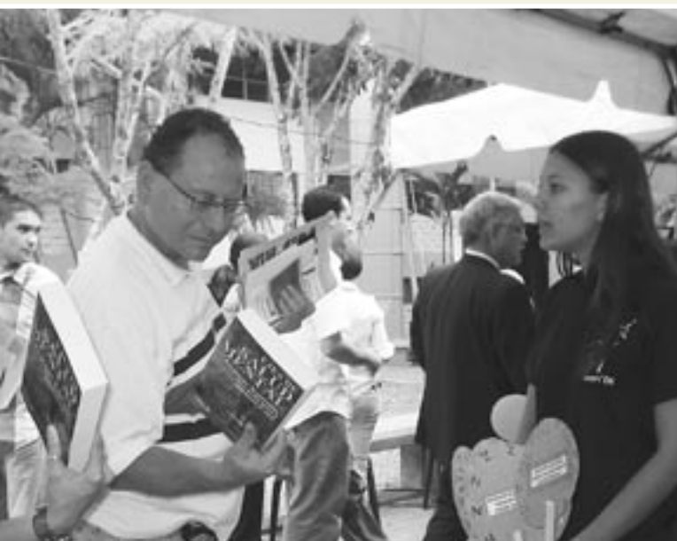
La Feria de la Salud despierta cada vez más interés entre la comunidad universitaria.