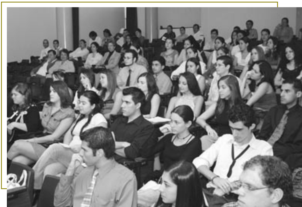
El grupo de estudiantes participantes en el proyecto asistió al acto de premiación que se efectuó en el auditorio Gonzalo González de la Facultad de Farmacia.

U nos 12 estudiantes que forman parte del proyecto Desarrollo personal y profesional de liderazgo y excelencia en el campo farmacéutico visitaron, del 24 de febrero al 10 de marzo, la Universidad de Colima, en México, gracias al apoyo recibido por el Programa de Voluntariado de la Vicerrectoría de Vida Estudiantil.