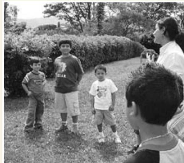
Como parte del taller se efectuaron diversas actividades al aire libre. (foto Escuela de Nutrición).