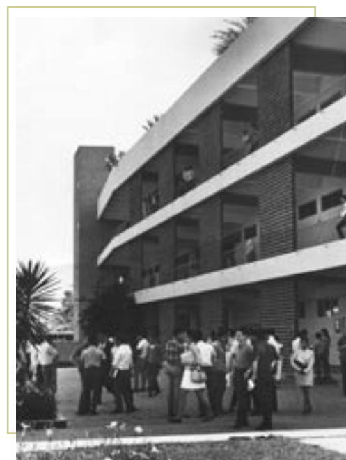
Cuando se abrió la Facultad, hubo un promedio de 787 estudiantes nuevos, contra 4.000 de hoy.

(Con un asterisco se indica a los profesores o funcionarios de tiempo completo o de medio tiempo. Se incluyen sólo los profesores que estuvieron en servicio activo.)