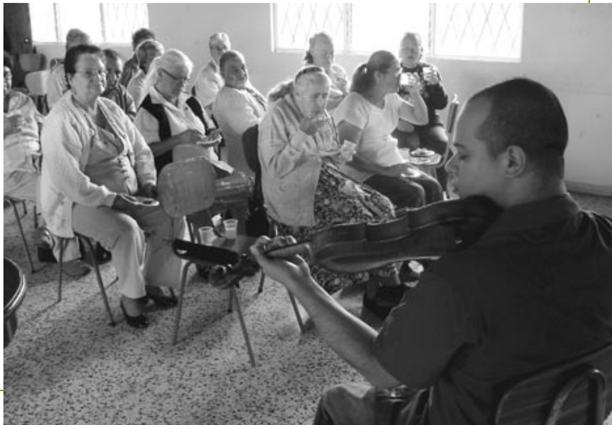
Presentaciones musicales, un refrigerio y hasta rifas acompañaron la actividad educativa realizada por la Facultad de Odontología.

Un gran interés por aprender y por implementar cambios en sus hábitos de higiene bucal y de alimentación son los principales resultados que destacan los especialistas de la Facultad de Odontología al referirse a un proyecto educativo que desarrollaron en los cantones de Goicoechea, Coronado, Desamparados, Montes de Oca y Curridabat con personas adultas mayores.