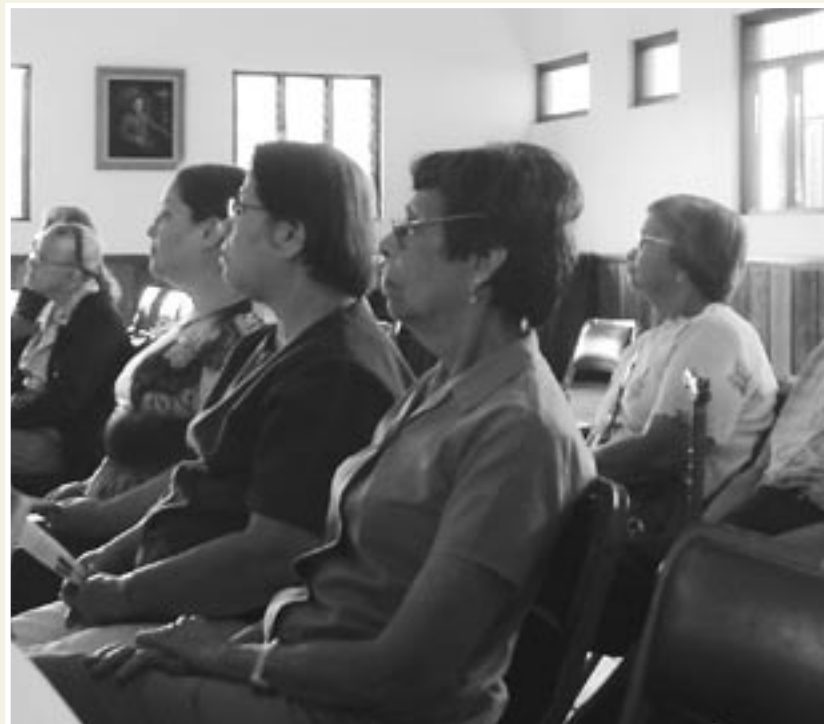
En el Salón Comunal de San Pedro se llevó a cabo una de las convocatorias.