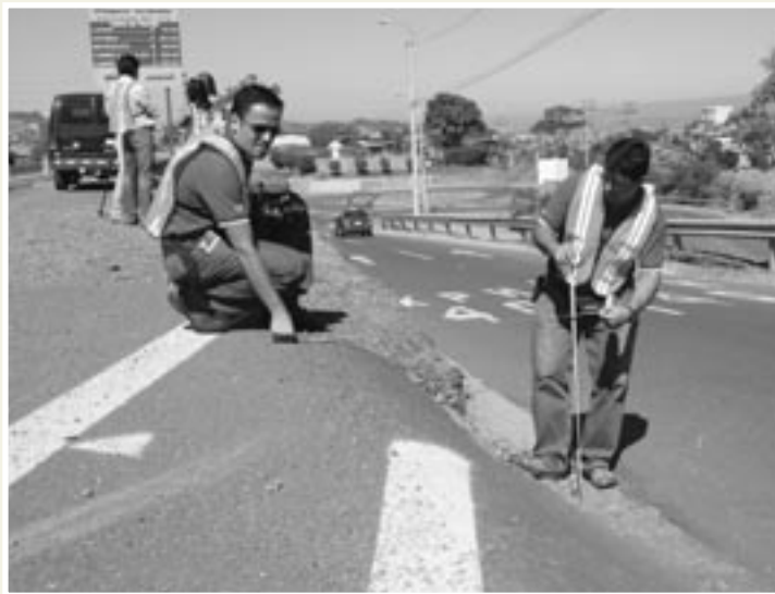
Como parte del curso, ingenieros del MOPT, de CONAVI, de las municipalidades y del LANAMME analizaron la seguridad vial en varios sitios de San José.

Los principales problemas que detectó un grupo de ingenieros del Laboratorio Nacional de Materiales y Modelos Estructurales (LANAMME) de la Universidad de Costa Rica, durante una auditoría de seguridad vial cerca del peaje a Santa Ana, fueron la colocación de paradas de autobús en la autopista Próspero Fernández, la ubicación de los guardavías y la escasa señalización.