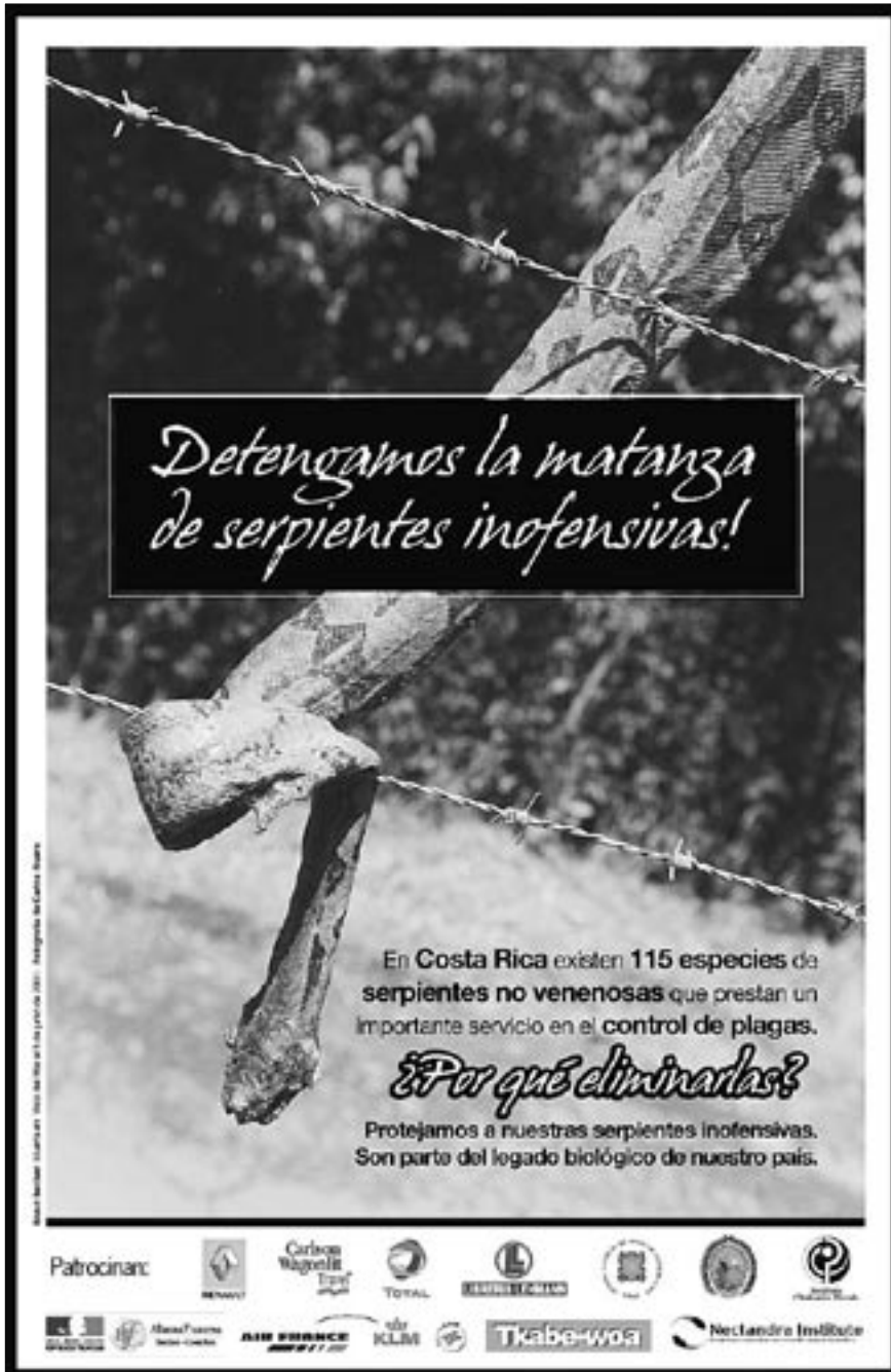
Uno de los afiches que forma parte de la campaña educativa para proteger las especies de serpientes no venenosas del país.

'D etengamos la matanza de serpientes inofensivas' es el lema de la Campaña Nacional que pretende proteger las 115 especies de serpientes no venenosas que existen en el país. Con afiches, reportajes, charlas y entrega de documentación dirigidos a las zonas más pobladas de serpientes esperan detener la matanza indiscriminada.