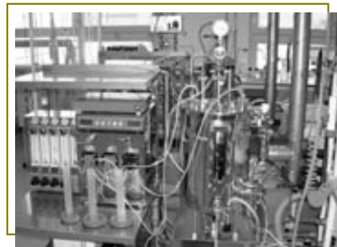
El CENIBiot contará con sofisticados laboratorios, pues se trata de un centro que nos proyecta hacia el futuro.