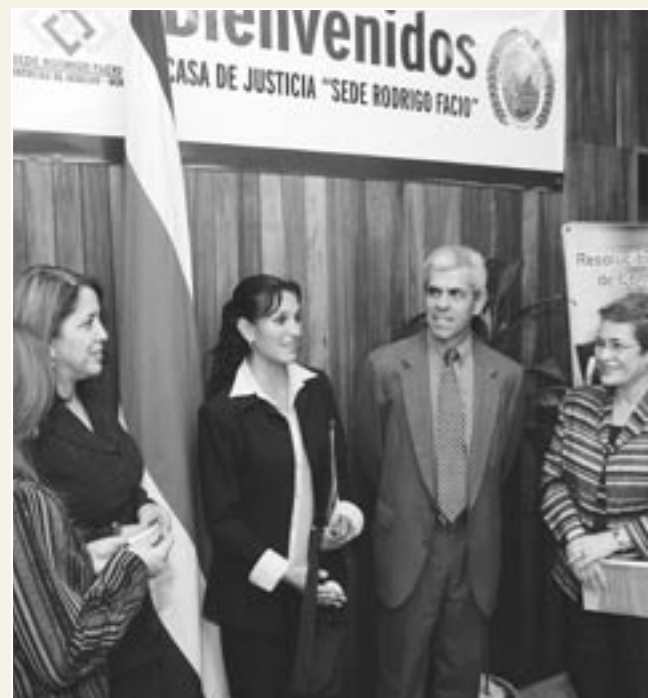
Autoridades de la UCR y del Ministerio de Justicia en las instalaciones de la nueva Casa de Justicia Sede Rodrigo Facio .