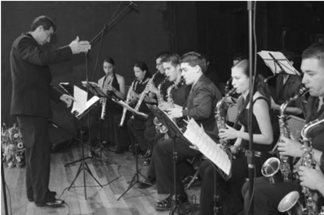
La temporada Martes por la Noche de la Escuela de Artes Musicales se ha convertido en un espacio único en el país.

La presentación de grupos de cámara, recitales de piano, canto, instrumentos de viento y la participación de intérpretes nacionales y extranjeros forman parte de los 34 conciertos que ofrecerá este año la temporada Martes por la Noche de la Escuela de Artes Musicales de la Universidad de Costa Rica.