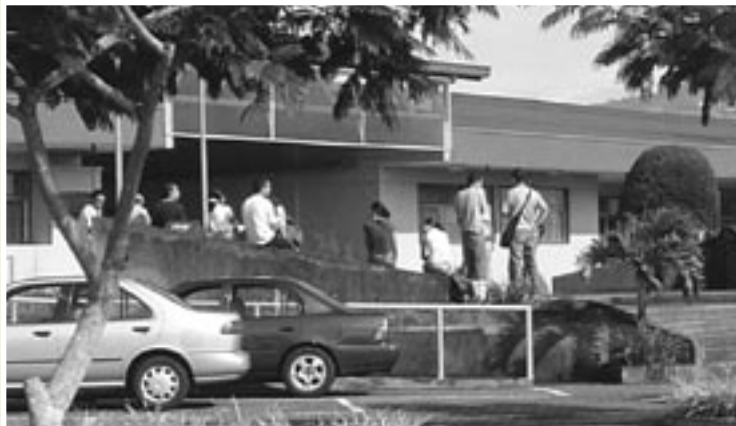
Instalaciones del Recinto de Paraíso de la Universidad de Costa Rica.