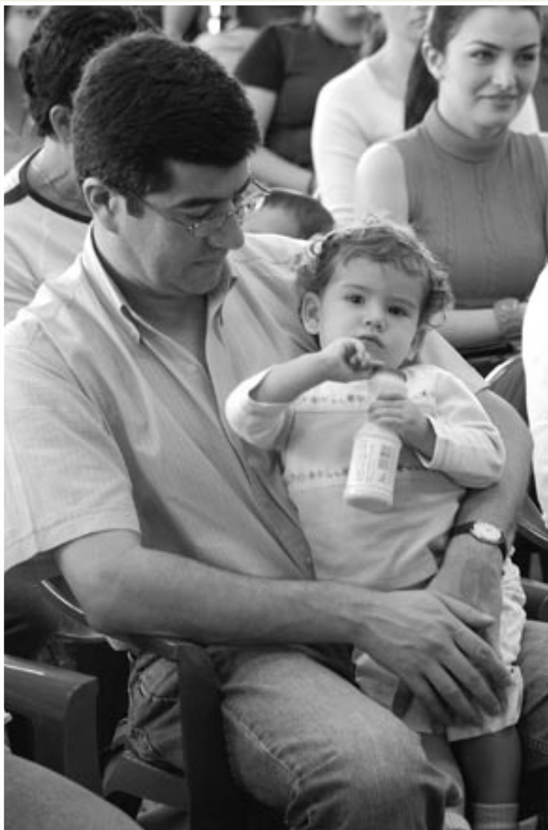
La Casa Infantil Universitaria de la Sede de Occidente atenderá a niños y niñas menores de 4 años, a partir del I ciclo lectivo de 2007. (Foto con fines ilustrativos)