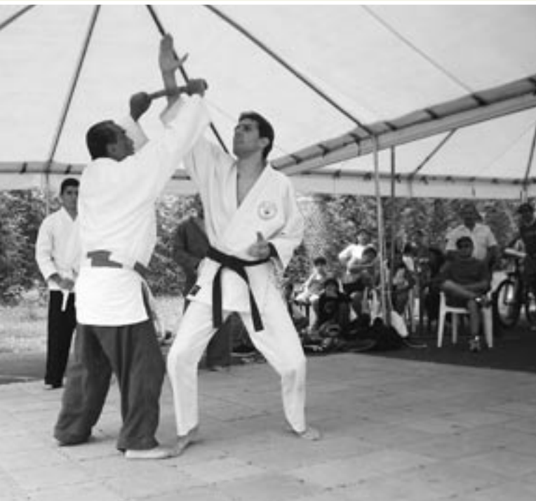
Las actividades deportivas también son un componente importante de la salud integral.

Con una alta participación y en un ambiente festivo se celebró este año la V Feria de la Salud integral 2007, organizada por la Oficina de Bienestar y Salud (OBS), de la Vicerrectoría de Vida Estudiantil.