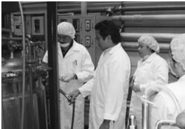
Una planta piloto con bioreactores nucleares se instalará en el CENIBiot, similar a esta que es parte del Instituto de Biotecnología de la UNAM, en Cuernavaca, Morelos, México.

D esarrollar unos 40 proyectos de innovación biotecnológica, beneficiar al menos a 30 empresas con servicios o paquetes tecnológicos e intensificar la relación Academia-Empresa mediante visitas de empresarios al CENIBiot, encuentros biotecnológicos y actividades de divulgación y capacitación son parte de las actividades que se ha propuesto el Centro Nacional de Innovaciones Tecnológicas (CENIBiot), luego de que el Ministerio de Ciencia y Tecnología anunciara su puesta en marcha.