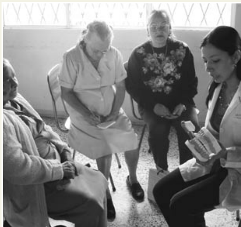
La técnica de cepillado, cómo lavar la prótesis dental y cómo evitar la molestia de boca seca forman parte de la capacitación que se le ofreció a las personas mayores.

Finalmente, comentó que los y las estudiantes participantes en la experiencia educativa enriquecieron mucho su formación en el campo gerontológico y geriátrico, pues los videos que produjeron servirán, incluso, en los cursos de odontogeriatría, impartido a estudiantes de quinto año de carrera.▶