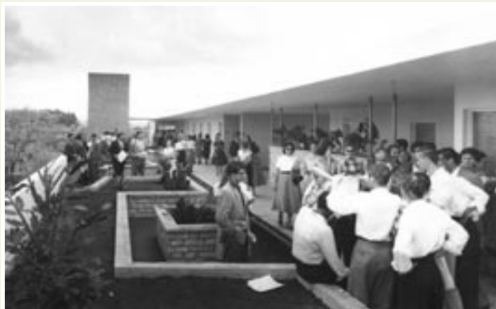
El edificio de Ciencias y Letras se inauguró un 4 de marzo de 1957.