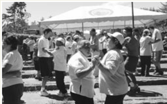
Actividad con personas adultas mayores en la Laguna de Doña Ana, en Paraíso de Cartago, organizada por el Grupo Recreación y Salud, del Recinto de la UCR en ese cantón.

En diciembre del año 2006 se celebraron los 15 años de presencia de la Universidad de Costa Rica en Paraíso , lo cual demuestra su consolidación y arraigo, no solo en beneficio de cientos de estudiantes de este cantón cartaginés, sino también de las zonas aledañas.