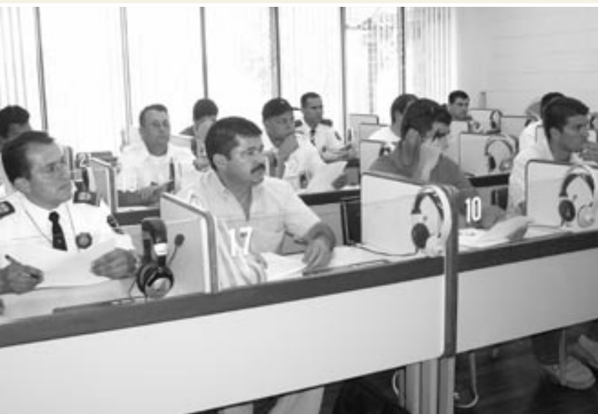
Los oficiales reciben parte del curso en el Laboratorio de Idiomas de la Sede de Occidente.

Desde el mes de febrero del presente año, 15 Oficiales de Tránsito de la región de Occidente participan en un curso de Inglés Conversacional gratuito en la Sede de Occidente de la Universidad de Costa Rica.