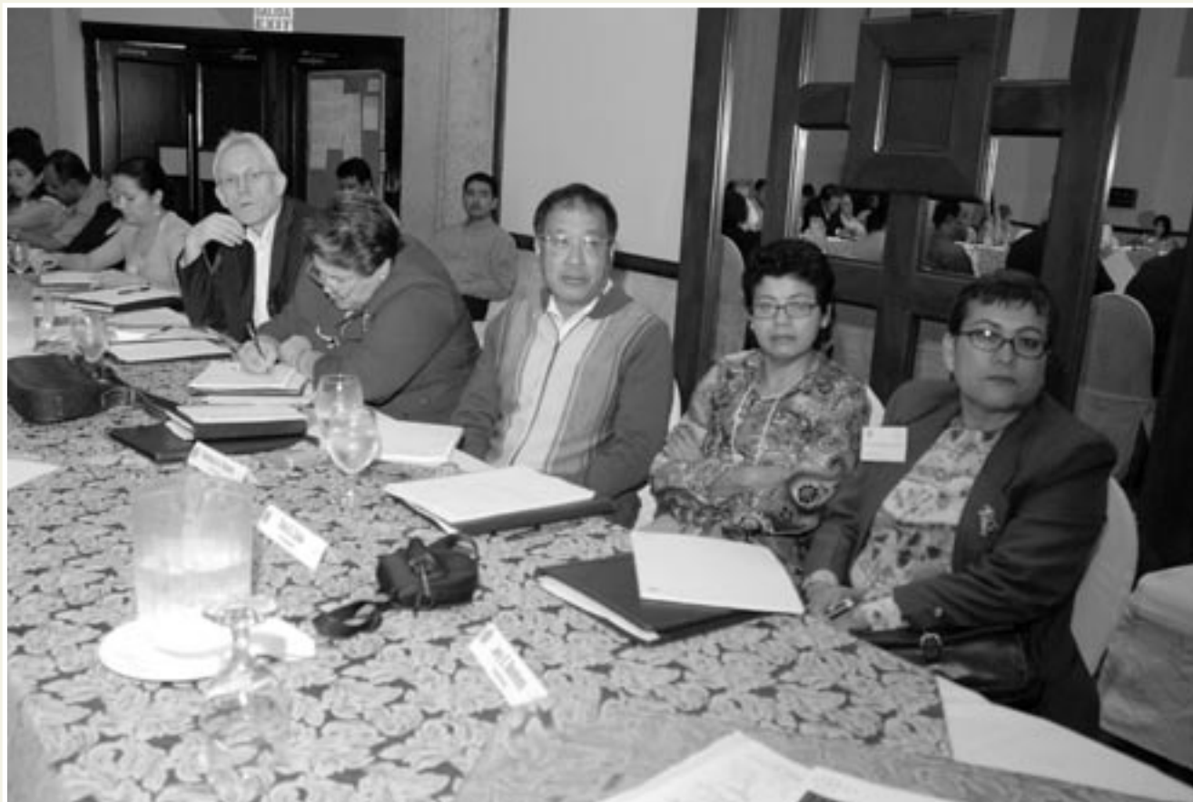
Durante una semana los/as académicos/as participantes conocieron procesos y resultados y planificaron actividades cooperativas para el futuro.

En este sentido destacó que a pesar de que su trabajo se enfoca en las áreas de la ingeniería y la técnica, la labor con las universidades es fundamental para contribuir con el desarrollo social y las humanidades. ▽