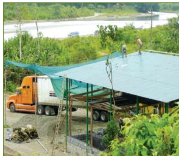
El centro de acopio está ubicado en Suretka, donde confluyen varios ríos de la zona.

Para ello se contó con una línea de crédito especial del Banco Nacional, que hizo sujetos de crédito a las y los indígenas, a pesar de que ellos no cuentan con títulos de propiedad que los respalden, con un año de gracia para iniciar sus pagos.