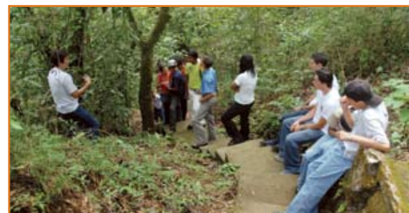
Estudiantes de enseñanza especial del Colegio de Valle Azul de San Ramón, experimentan y aprenden de las ciencias naturales.

Para los participantes del proyecto este es un bosque encantado donde los niños, niñas y adultos disfrutaron desde el avanzar de un perezoso hasta el recorrido de una fila de hormigas que construyen su castillo en lo más profundo de un hueco.