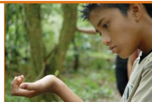
Los estudiantes aprenden a convivir con la naturaleza.

Alfredo Villalobos Jiménez <avjimene@cariari.ucr.ac.cr>