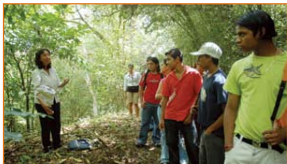
Con este proyecto, los estudiantes disfrutaron de las visitas guiadas.

Es una vivencia científica al alcance de niños de preescolar, escolar y estudiantes colegiales de las diversas comunidades que participan en las visitas guiadas organizadas por los profesores y estudiantes de biología, informática, trabajo social, inglés, laboratorio químico, derecho, ingeniería industrial, dibujo, turismo ecológico y matemáticas.