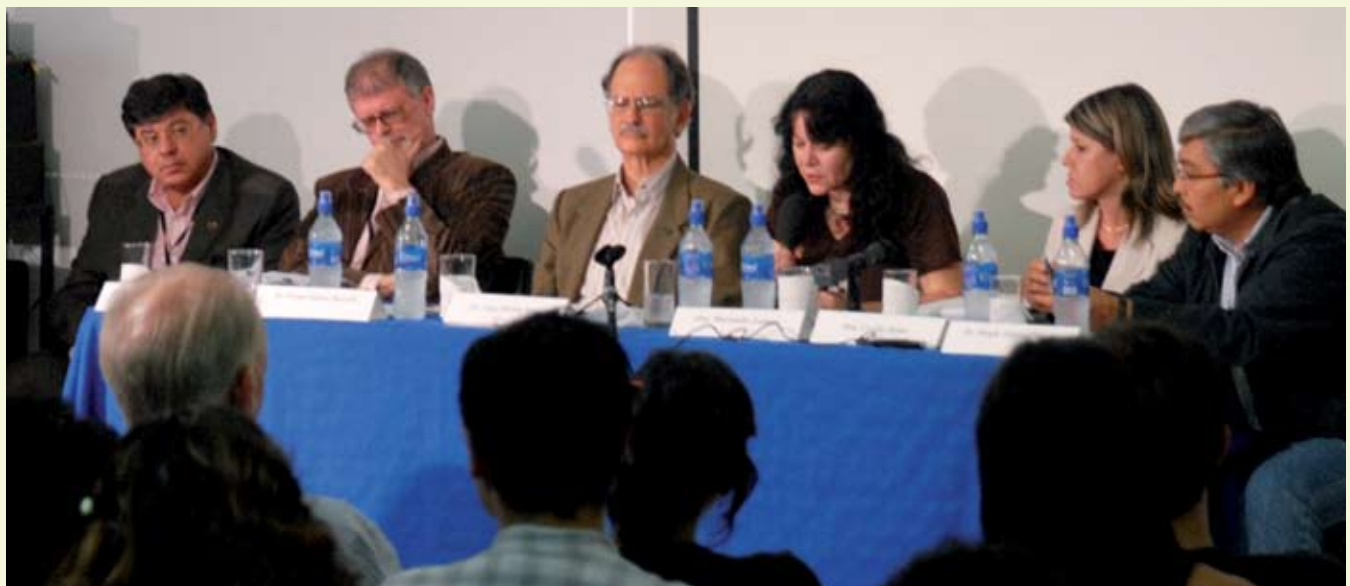
El Coloquio “La Sociología latinoamericana hoy: Un encuentro intergeneracional y entre géneros” reunió durante dos días a seis especialistas de diversos países en la Universidad de Costa Rica.

La autora de la investigación concluye que sostener que no se ha dado importancia a la educación sexual es inexacto, ya que como lo demuestra el trabajo, el tema ha permanecido como preocupación fundamental en los diferentes libros y desde diversos enfoques.