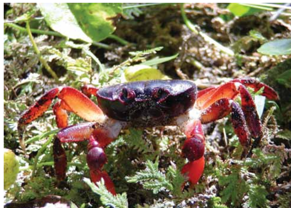
Los miembros jóvenes de esta especie de cangrejo son de color morado con las patas naranja.

Además, debido a su formación geológica, esta isla costarricense tiene características ecológicas mucho más parecidas a los territorios