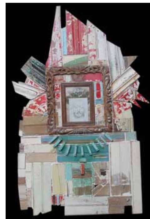
Copán , del artista costarricense Roberto Lizano, realizado mediante la técnica de ensamblaje en 1998.

Vargas aseguró que el remanente del arte precolombino “siempre lo hemos tenido en la cultura y ha sido muy variado. Muchos dicen que estamos perdiendo los elementos indígenas, pero con esta investigación se da a conocer una variedad muy grande de expresiones artísticas que no se han tomado en cuenta ni se han valorado”.