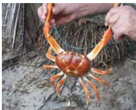
El macho adulto de la especie denominada Johngarthia cocoensis mide 40 cms. de largo (foto Michel Montoya, Fundación de Amigos de la Isla del Coco).

“Es el descubrimiento del siglo en la taxonomía de la familia Gecarcinidae en el mundo”, aseguró la especialista M.Sc. Rita Vargas Castillo, especialista en taxonomía de crustáceos, quien celebró el hallazgo, pues desde 1912 no se describía una especie de esta familia en todo el planeta.