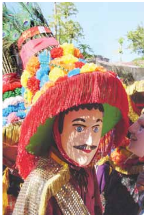
Personaje del baile del Toro Guaco, en Diriamba, Nicaragua.

El proyecto denominado El remanente precolombino en el diseño centroamericano contemporáneo incluyó la producción artística y artesanal de autores y autoras de Costa Rica, Nicaragua y Guatemala.