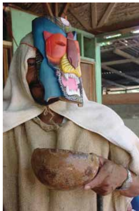
Personaje con máscara de jaguar y serpiente del baile de Los Diablitos, de la cultura indígena boruca de Costa Rica.

Entre los temas tomados en cuenta por los artesanos para la elaboración de las máscaras, destacan los prehispánicos, de la Conquista o